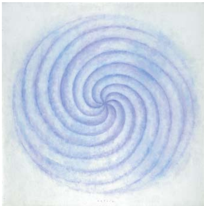
Václav Boštík (*1913) Otáčení III, 1969

Allegro vivace, Andante cantabile, Menuet, Molto allegro