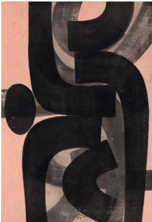
Libor Fára (1925–1988) Rytmus I , 1960