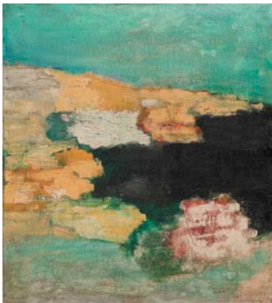
Michal Ranný (1946–1981) Skály , 1965/66