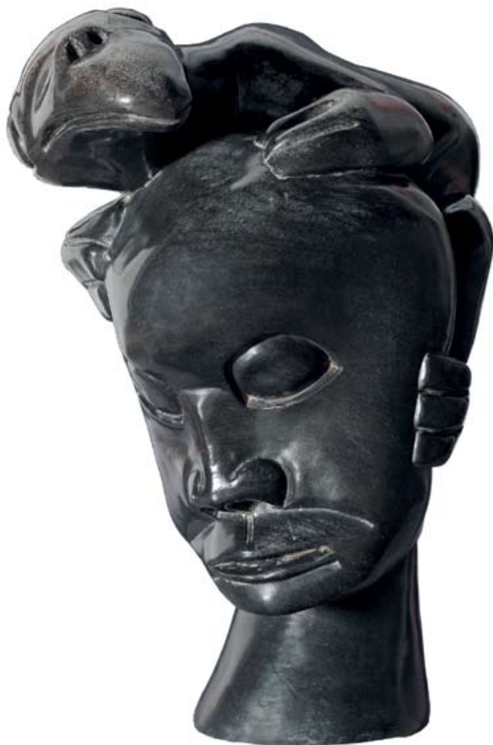
Neznámý autor (Zimbabwe), Africké sny , (kolem 1960–70)

Z výstavy Od Konga k Zambézi – plastiky a malba (Kongo, Zambie, Zimbabwe) , Wortnerův dům AJG, České Budějovice 14.12.2006–4.2.2007