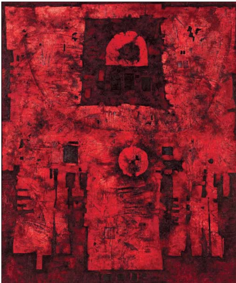
Mikuláš Medek, Oslava 21 870 červených cm 2 , 1962