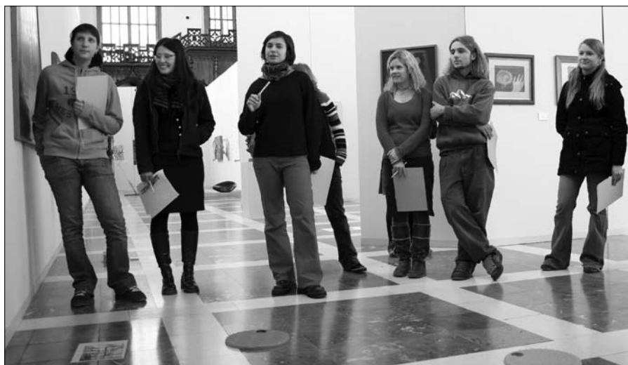
Studenti českobudějovického Gymnázia Jírovceva při prohlídce výstavy České umění XX. století (1940–1970) v Hlavním sále Alšovy jihočeské galerie v Hluboké nad Vltavou.