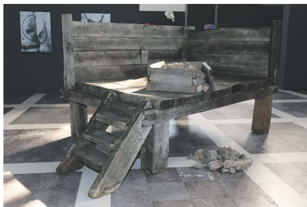
Ke klíčovému dílům výstavy patří existenciální objekt Jiřího Beránka Kout z roku 1982

členem vlivné mezinárodní skupiny Fluxus. V roce 1990 byl jmenován rektorem Akademie výtvarných umění a v roce 1999 se stal generálním ředitelem Národní galerie, čímž jako zástupce „truchlivé generace“ dosáhl na nejvyšší posty, o něž v českém prostředí mohl umělec usilovat. ■